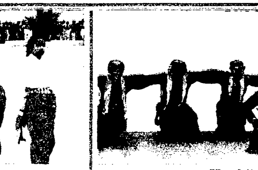
جانب من العرض الفني للمدرسة

محمد ابو عزيز استعرض الفنان حسان الشريف في معرضه الشخصي بالمرکز الثقافي الاسلامي الذي افتتحه سمو الاميرة وجسمان علي، اعمالا تجريبية تعبيرية ذات تكامل ما بين الكويكبات التي قدمها الفنان وجارة الاوان المستخدمة والذي يمس من اهم خصائص الاشكال الجميلة. تطرق الفنان الشريف لبعض اعماله مركزا على التكوين ونحو التجديد محاولا الابتعاد عن العمل التقليدي المتعود عليه المتلقي فشكل اعمالا على هيئة (V) يلتقي عند تقاطع النراس واضاف في الشكل عمال صغرى يوحى بنوع من تكاملية الشكل (مربع مكعوف. احد وجنات المكب) شكل بطريقة ناخذ بها توحى بحرف (ن) منسبي التكوين وفي اغلب الاحيان تكمل او تعادل بعضها. انتا ترك ان العنصر التي طرحها الفنان والتي تصورها وتاملها هي اشكال مبني على بكيرة، فالاشكال هندسية الطابع تطفي على هجنس الفنان وضمن تشويحات من ناحية الحجم، المربعات والمثلثات هي اشكال صامتة جميلة بمعنى انها لها هويتها الشكلية الحكيمة المليء بالبهجة والجمال.